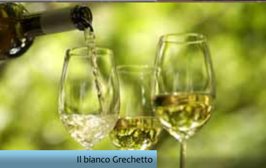
Il bianco Grechetto