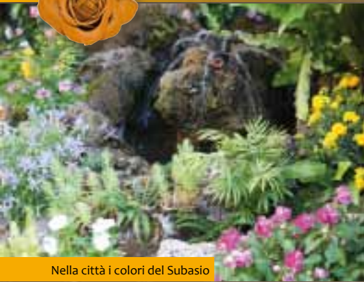
Nella città i colori del Subasio