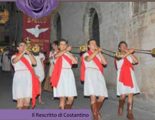
Il Rescritto di Costantino