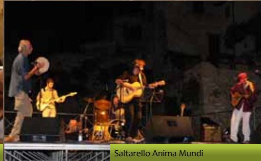
Saltarello Anima Mundi

La vitalità del borgo di Spello in una performance collettiva di sapori, colori, monumenti e paesaggi. Exolea , giunta alla sua quinta edizione, è una manifestazione di nuova generazione dedicata all'olio extravergine di oliva, chiave di accesso al territorio ed elemento fondante della sua cultura.