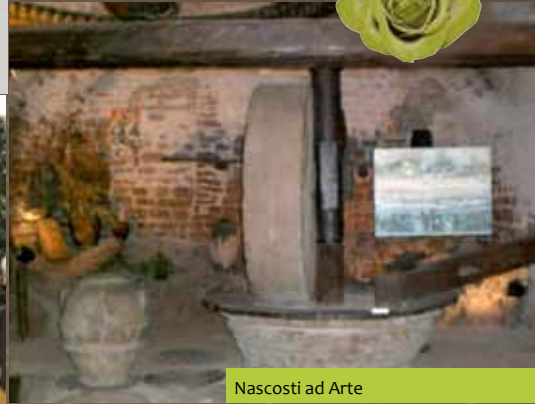
Nascosti ad Arte