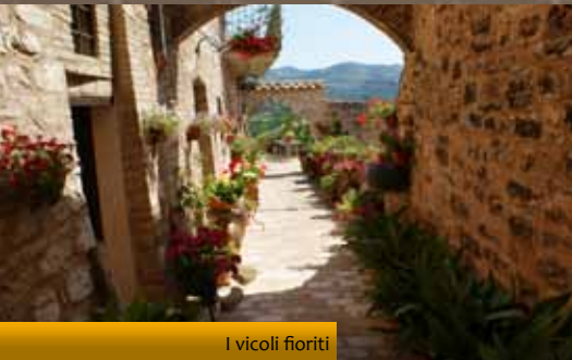
I vicoli fioriti