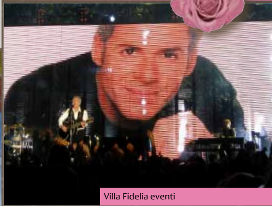
Villa Fidelia eventi