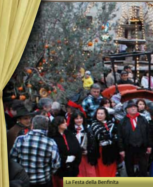
La Festa della Benfinita