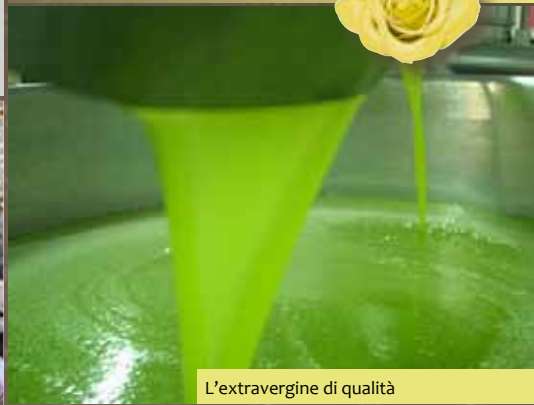
L'extravergine di qualità