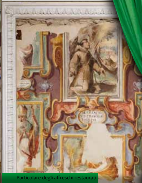
Particolare degli affreschi restaurati