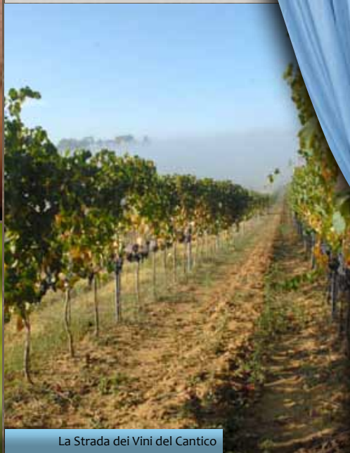
La Strada dei Vini del Cantico

La Rassegna del Grechetto è la festa dedicata al bianco vino umbro, giunta ormai alla XXII edizione, che si tiene ogni anno a luglio nella frazione spellana di Capitan Loreto. Vitigno autoctono dell'Umbria, il Grechetto è un vino cristallino dall'aroma delicato di frutta e il profumo floreale che si sposa con piatti di pesce, carni bianche, frittate fino alle zuppe di lenticchie. Con serate danzanti, stand gastronomico e spettacoli teatrali, la località di Capitan Loreto si trasforma all'insegna dell'allegria e della genuinità, invitando