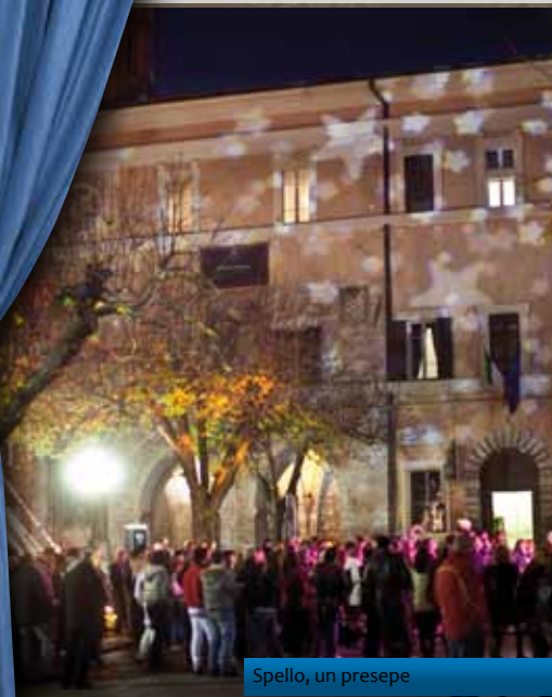
Spello, un presepe