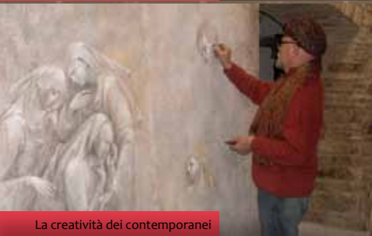
La creatività dei contemporanei