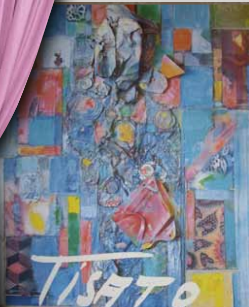
Le mostre per le strade