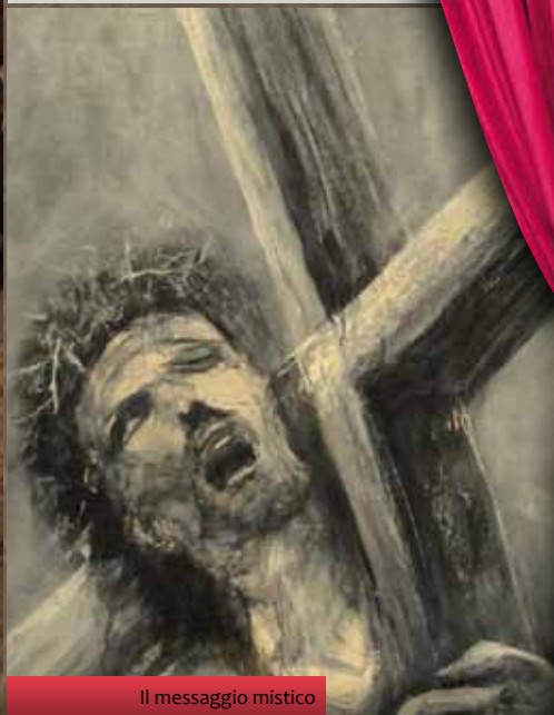
Il messaggio mistico

La tradizionale processione del Venerdì Santo ha fatto pensare alla città storica come ad un unico grande luogo espositivo. Le quattordici stazioni che celebrano la Passione del Cristo diventano motivo d'ispirazione per artisti nazionali ed internazionali che, per l'occasione, realizzano dipinti da collocare in alcuni siti della città antica, corrispondenti all'iconografia cattolica con la quale ogni anno vengono ricordate le tappe del Cristo condannato a morte verso il Monte