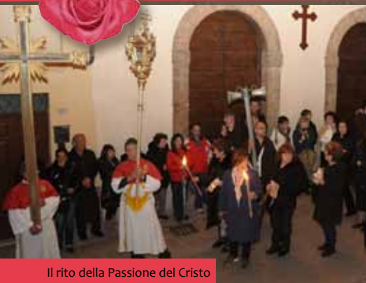
Il rito della Passione del Cristo