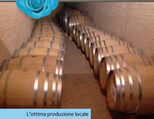
L'ottima produzione locale