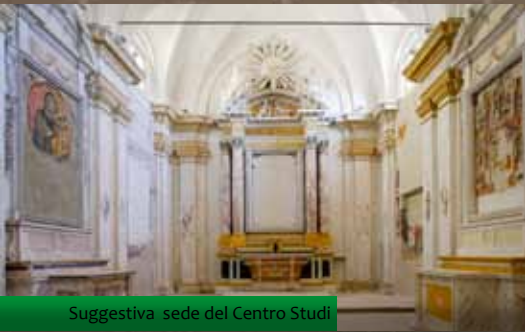
Suggestiva sede del Centro Studi