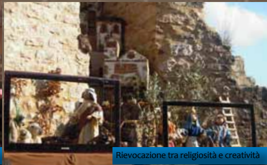
Rievocazione tra religiosità e creatività

Dal 18 dicembre la città di Spello, attraverso un significativo cartellone per il periodo natalizio, propone la singolare rassegna culturale “INCONTRI... a Natale” . Con il concorso “Spello in Presepe”, le opere elaborate dagli Spellani costituiscono l’espressione più attrattiva della tradizione religiosa locale. I luoghi d’arte e di storia, gioielli d’arte recuperati e restituiti alla collettività, sono aperti per essere fruiti e valorizzati; suggeriscono per-