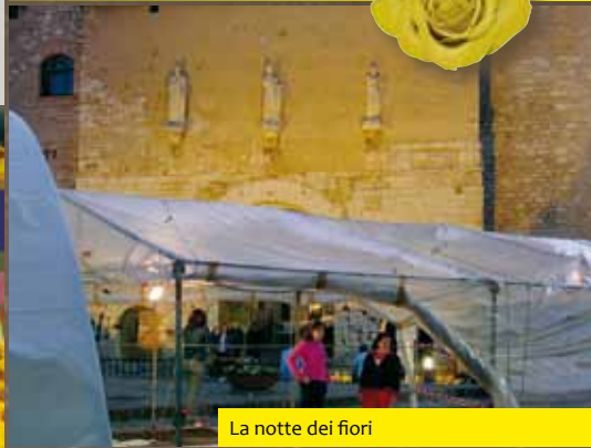
La notte dei fiori