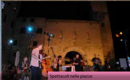
Spettacoli nelle piazze

Incontri per le strade nasce nell'estate del 1980 con lo scopo di promuovere la cultura del territorio attraverso le tradizionali manifestazioni artistiche del borgo.