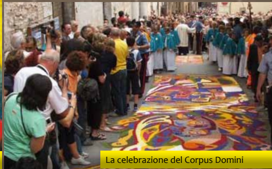
La celebrazione del Corpus Domini

Le Infiorate di Spello , realizzate in occasione della festività del Corpus Domini , sono composizioni floreali che rappresentano figurazioni e motivi ornamentali liturgici. Richiedono un lavoro di preparazione di settimane, ma vengono completate con i fiori freschi nell'arco di una sola notte. Usando solo fiori ed erbe profumate, si ottengono figure dai colori smaglianti e sfumature raffinate. Capolavoro della creatività artistica spellana, le Infiorate risalgono agli inizi del 1900 e sono conosciute e apprezzate per le dimensioni e la qualità artistica delle opere realizzate e per le emozioni e il