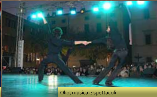
Olio, musica e spettacoli

È l'evento che chiude il mese di "Frantoi aperti" con cui si celebrano in Umbria le Strade dell'Olio nuovo. L' Oro di Spello è dedicato al prodotto principe del territorio. Una zona interamente DOP in cui l'olivo "moraiole", impreziosito dal microclima del Subasio, conferisce all'olio straordinari valori organolettici. Da non perdere le cene nelle taverne dei tre terzi, il Palazzo del gusto con banco di assaggio a cura dei produttori locali, le visite guidate ai luoghi di produzione e molitura, le