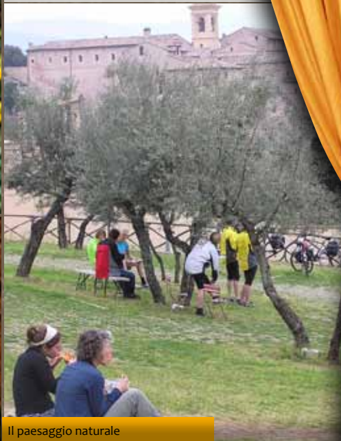
Il paesaggio naturale

Tutta la città si trasforma in occasione dell'annuale Concorso "Finestre, balconi e vicoli fioriti" che giunge quest'anno alla sua sesta edizione. Promosso dalla Pro loco di Spello, in collaborazione con il Comune di Spello, l'Associazione Le Infiorate di Spello e con il patrocinio della Facoltà di Agraria dell'Università degli Studi di Perugia, il concorso si pone l'obiettivo di incentivare e promuovere gli aspetti estetici e i valori ambientali e turistici della