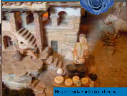
Nei presepi la Spello di un tempo