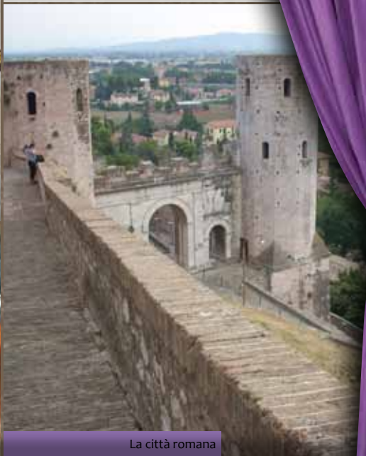
La città romana

Dal 19 al 22 agosto la città di Spello rivive le antiche e gloriose suggestioni della civiltà romana attraverso spettacoli, scene di vita dell'epoca, cene a tema, ambientazioni e iniziative culturali pomeridiane. Spello divenne Colonia romana in età triumvirale-augustea. Ostile ad Antonio parteggiò per Ottaviano, vincitore della guerra di Perugia. In onore della famiglia imperiale assunse il nome di Splendidissima Colonia Iulia Hispellum . Ottenne poi privilegi da Costantino il Grande, dal quale ebbe il nome di Flavia Constans e l'au-